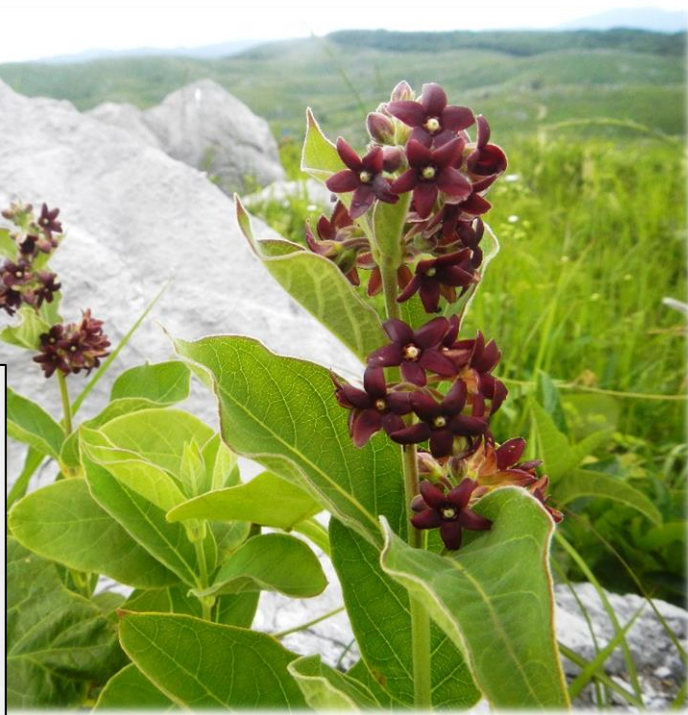
フナバラソウ (Mine 秋吉台ジオパーク)