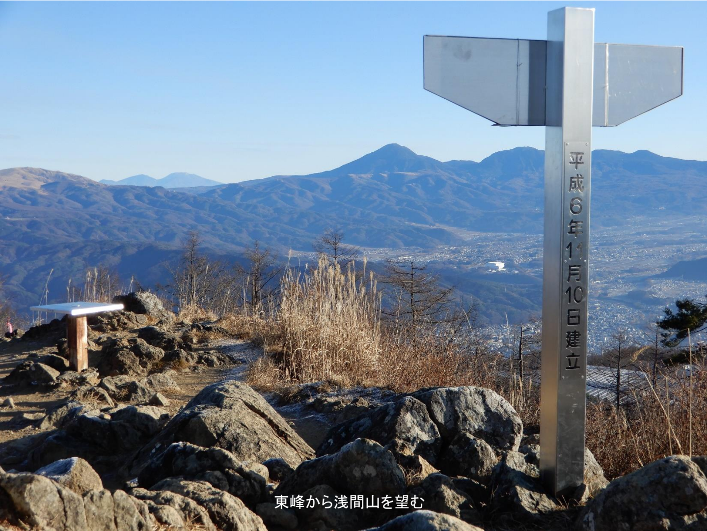
東峰から浅間山を望む